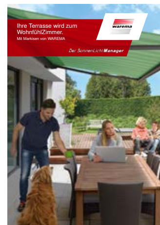
Lösungen für die Terrasse