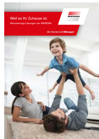
Lösungen für die Renovierung