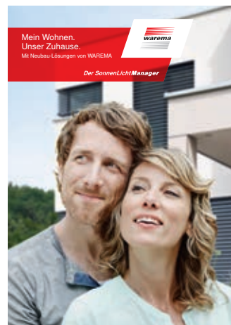
Lösungen für den Neubau

In unseren weiteren Broschüren erfahren Sie noch mehr zu Lösungen und Produkt-Highlights von WAREMA. Einfach herunterladen oder anfordern unter www.warema.de/prospekte .